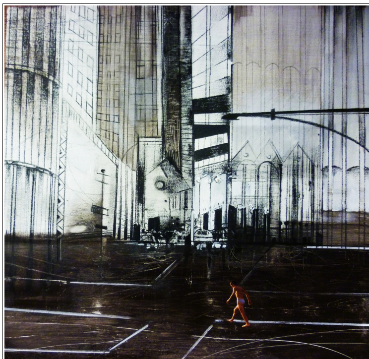
1) "Nuovi spazi", 30x30cm tecnica mista su tavola, 2013

Vi erano mille omini in strana sospensione, alla ricerca di un qualcosa che forse mai, in nessun luogo, avrebbero trovato se non in fondo a loro stessi. Camminavano a perdi fiato su di un filo stretto e lungo mentre mondo girava intorno e tracciava le sue tele..