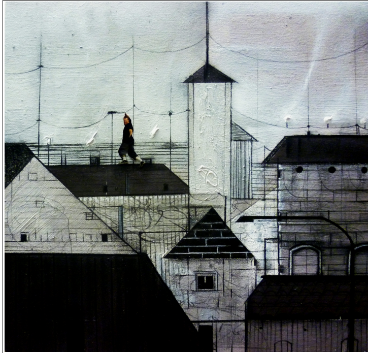
2) "In equilibrio " , 30x30cm tecnica mista su tela, 2013