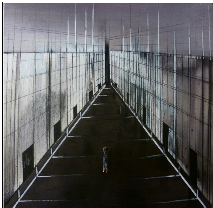
3) "Cantiere 2" , 30x30cm tecnica mista su tela, 2013